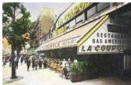
La Coupole en 1938

A cet univers presque inchangé de trois quarts de siècle sont venues se juxtaposer les créations contemporaines du centre Maine-Montparnasse dont la tour illustre assez bien les conceptions urbaines en vigueur au début des années 70, où le genre de vie américain était encore pris pour modèle. Au pied de celle-ci, le boulevard de Montparnasse a moins changé. Il est très vivant et animé tard la nuit par les salles de cinéma, les cafés ou les brasseries du carrefour Raspail.