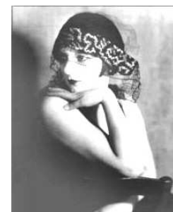
Kiki de Montparnasse