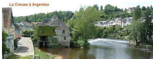
La Creuse à Argenton

Aujourd'hui, comme hier, le monde des vallées continue d'attirer. Si l'histoire des peintres ne croise plus si souvent celle des visiteurs épris de nature, du moins continue-t-elle à fasciner. Les musées du monde entier en conservent les couleurs et les élans sauvages.