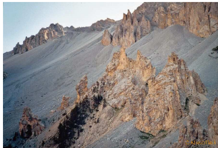
La Casse Déserte